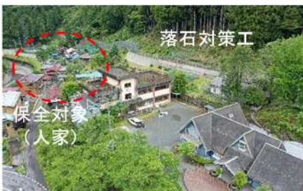
砂防関係施設整備