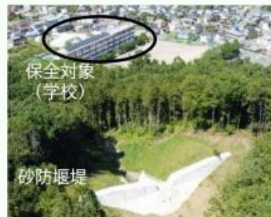
砂防関係施設整備