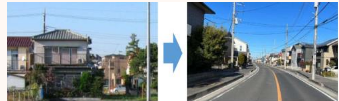
土地区画整理事業により整備された都市計画道路

安全性・利便性向上に配慮した都市基盤を整備し、誰もが暮らしやすく魅力あるまちづくりを進める。