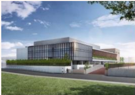
朝霞児童相談所(仮称)イメージ